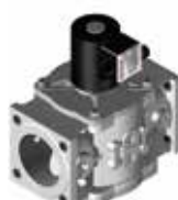
Gazowy zawór bezpieczeństwa 1 1/2" do DN 300 EN 161