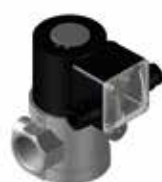
Gazowy zawór bezpieczeństwa 1/2" do 1" EN 161