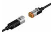
Złącza wtykowa Deutsch