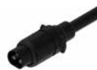
Złącza wtykowa ST3