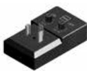
Sterownik czasowy zaworu