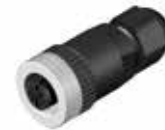
Złącza wtykowa M12 do konfekcjonowania