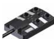
Moduł aktor-sensor M12