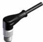
Złącza wtykowa M12