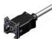
Złącza wtykowa JPT