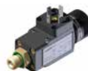
Wyłącznik ciśnieniowy Hydraulika