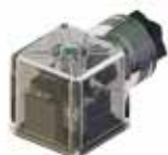
Złącza wtykowa DIN-EN