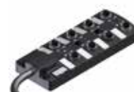
Moduł aktor-sensor M8