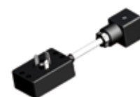
Moduł oszczędności energii PWM