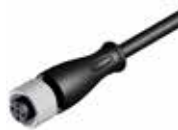
Złącza wtykowa M12