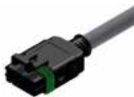
Złącza wtykowa Delphi