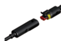
Złącza wtykowa Superseal