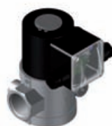
Safety Gas Valve 1"