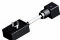
PWM Energy Saving Module