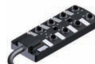
M8 Actuator-/ Sensor-Box