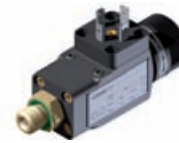
Pressure Switch Hydraulic