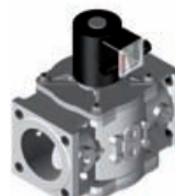
Safety Gas Valve 2 1/2"