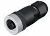
Connector M12 Field attachable