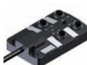
M12 Actuator-/ Sensor-Box